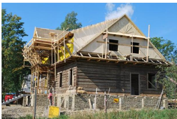
Odbudowa przeniesionej chałupy