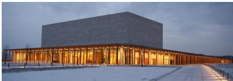
Europejskie Centrum Muzyki Krzysztofa Pendereckiego w Lusławicach