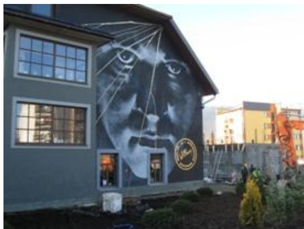
Budynek główny Teatru