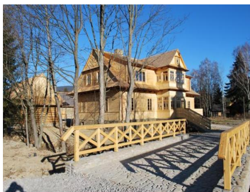
Most nad potokiem