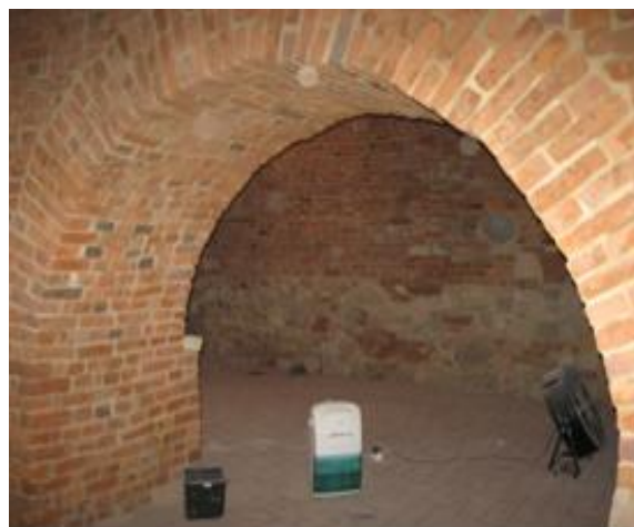
Patio jako przestrzeń dla biblioteki