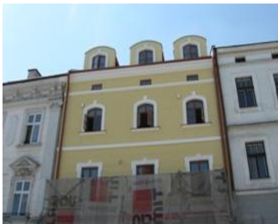
Elewacja kamienicy Rynek 3